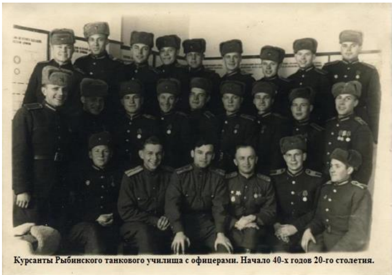
Курсанты Рыбинского танкового училища с офицерами. Начало 40-х годов 20-го столетия.