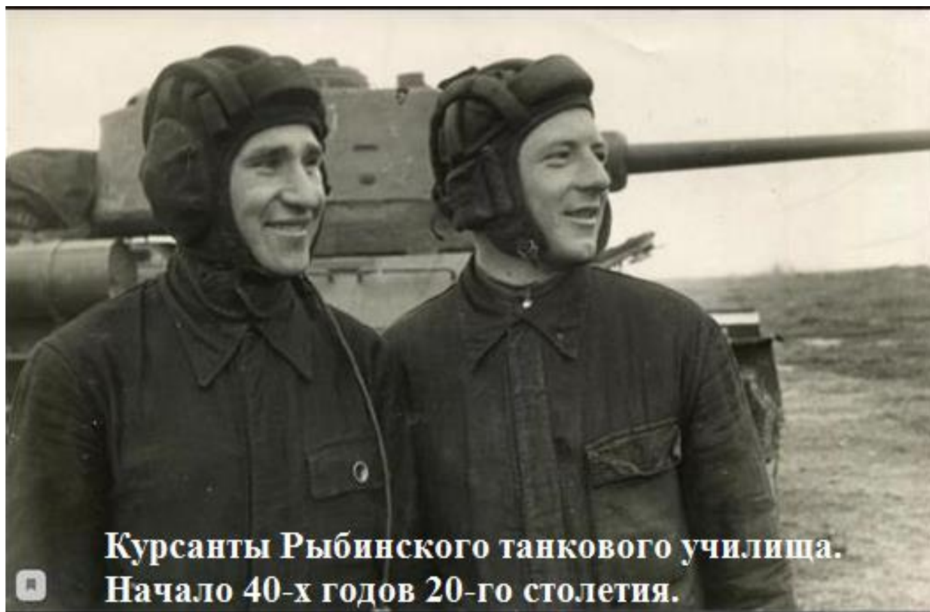
Курсанты Рыбинского танкового училища. Начало 40-х годов 20-го столетия.